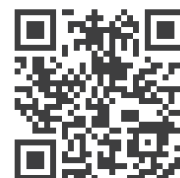
【イベント申込フォーム】